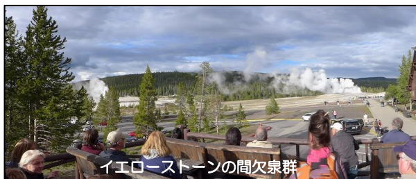
イエローストーンの間欠泉群