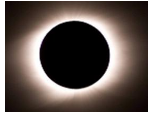
日食観測地：アイダホ州Rexburg市

またこの日食は全米を横切る好条件ではありますが、晴天率については西側の地域（図1水色部）が条件良いとされています。