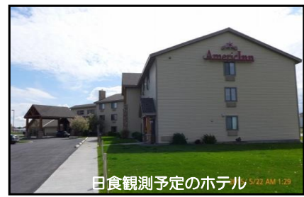
日食観測予定のホテル 5/23 AM 1:29

【企画】 日本天文同好会 加瀬部 久司 TEL：090-2596-4008 【手配】 アストラベルサービス株式会社（担当：大竹 智子） TEL：06-6947-7190 メールアドレス：as-travel@pop16.odn.ne.jp