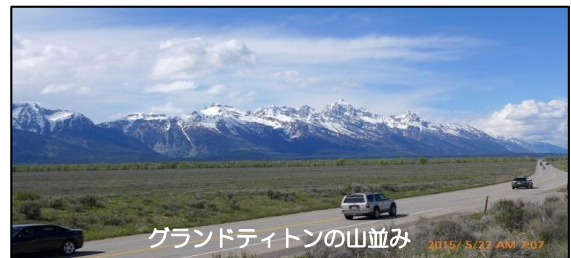
グランドティトンの山並み 2015/ 5/23 AM 9:07