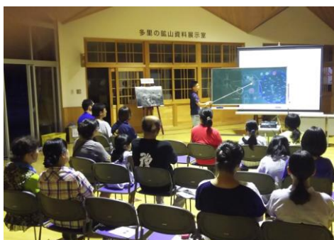
子供たちによる研究発表の様子

日南町内には多里以外にも多くの星空スポットがあります。夜の街が暗い事は地域振興にとってマイナスではなく、暗いからこそ見える物がある。写真では伝わらない本物を体感する感動をこれからも伝えていきたいです。